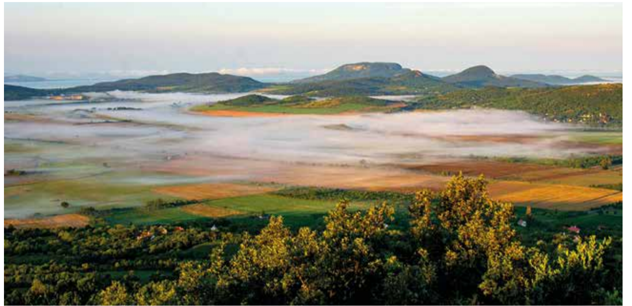
Nyári reggeli panoráma az Eötvös Károly kilátóból

A hétnapos programon Monostorapátiból, az Eger-patak völgyéből indulnak az erdei vándorok. Meghódítják a hegyesdi várrmot, ahonnan megcsodálják a tanúhegyeket, majd az almádi romtemplomon át érkeznek a Balaton-felvidéki Erdészeti Erdei Iskolába. Célba veszik a nagyvázsonyi Kinizsi-várat, felkeresik a