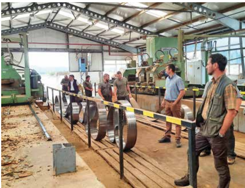
A szakmai napot a Franciavágási Fűrészáru Gyárban kezdték

A 2003. évben indult erdészeti beavatkozások és erdőtervezések során jellemzően egykorú, egy tömbben található, nagy területű erdőrészek (10-15 ha) voltak a jellemzőek (Ajka 62, 63, 68, 69-es tagok).