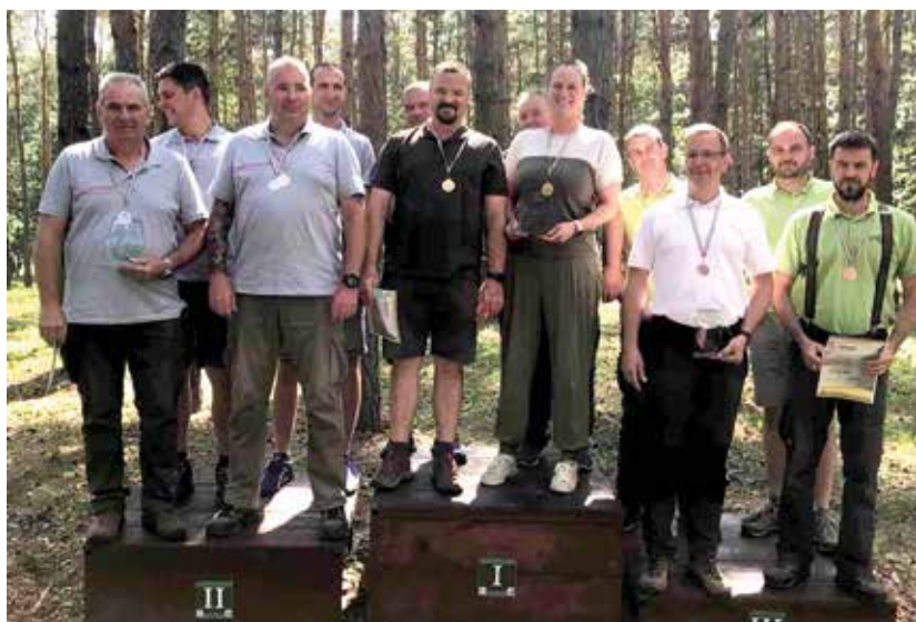
A dobogó harmadik fokán a csapatunk