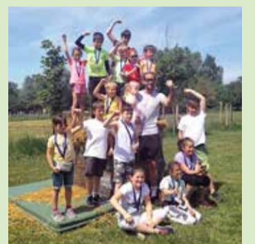
Kis inasok az élményközpontban

Az élményközpont oktatási-nevelési célokat szolgáló tevékenysége a szálláshellyel bővülve további lehetőséget biztosít a környezeti nevelést segítő, bentlakásos programok megvalósulásához. A jövőbeni tervek között szerepel, hogy kerékpáros, gyalogos turisták számára az elkövetkezendő években szálláshelyként is szolgálhassanak az elkészült jurták.