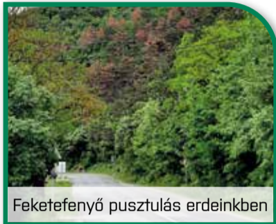
Feketefenyő pusztulás erdeinkben