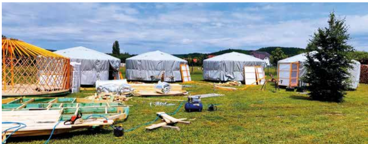
Épülő jurtatábor a Balaton-felvidéken

Az aktuális programokról az intézmény folyamatosan frissülő Facebook-oldalán, és honlapján tájékozódhatnak az érdeklődők.