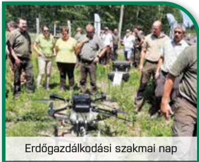
Erdőgazdálkodási szakmai nap