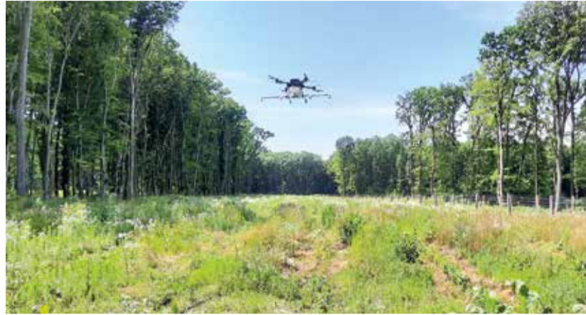
A drónok egyre inkább nélkülözhetetlenné válnak az erdőgazdálkodásban

A program az Ajka 43 A erdőrésztelben folytatódott, ahol a B. L. Agro-kem Kft. és a WohnderDrone Kft. tartott drónos permetezési bemutatót. Bebizonyosodott, hogy a fakitermelések végrehajtásának ellenőrzésében, az erdőfelújítások ápolása, a gyomirtás és inváziós fajok elleni védelemben, valamint a növény-egészségügyi állapotok nyomon követésében a gazdálkodók hasznára válik a dróntechnológia. A permetező drónok a precízebb permetezés végrehajtásában, a növényvédőszer felhasználás csökkentésében és a meg nem közelíthető helyek növényvédelmében is úttörő szerepet kell kapjanak. Ezekkel a képességekkel a gazdaságosabb munkavégzés, a környezetterhelés csökkentése válik lehetővé. Az erdőtervezésben és felügyeleti munkák végrehajtásában a monitoring drónoknak jut egyre nagyobb szerep.