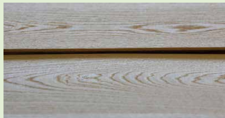
A fedőrétegyártásban nagy potenciál rejlik