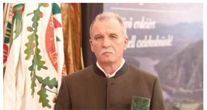
A kitüntetés átadására a gödöllői kastélyban, az Országos Erdészeti Egyesület 152. vándorgyűlésének alkalmával került sor

Már az Ugodi Erdészetiénél végzett munkája során is közismert volt megbízhatósága, precizitása. Alaposságának, lelkiismeretességének köszönhetően több alkalommal bízták rá külön feladatot, sajátja mellett szomszédos erdészkerületek (Kőgyúnyhói, Molnárkúti kerületek) vagy a speciális szak tudást igénylő huszárokélopusztai csemetekert ideiglenes vezetését. Irá-