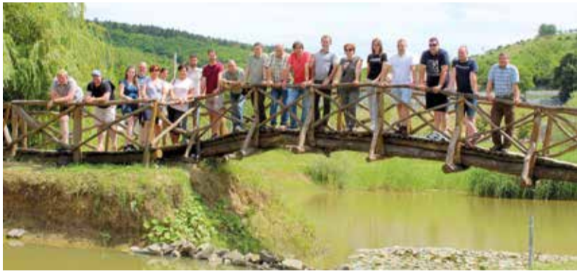
Most nem a víz az úr...

Társaságunk a szakmai napot az NFK hozzájárulásával választható kiegészítő képzésként akkreditáltatta.