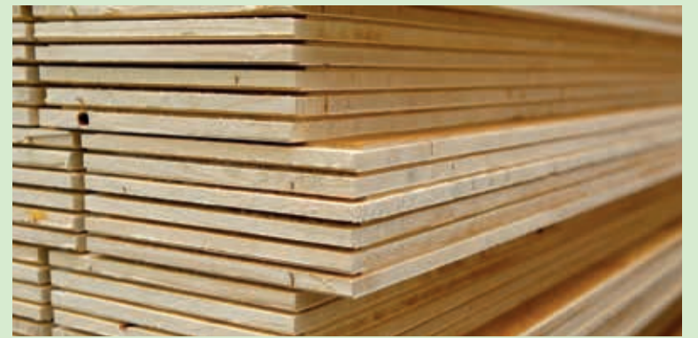
Az orosz-ukrán háború jelentős hatással van a parketta alapanyag beszerzési lehetőségeire

Március végén kiadtuk a kávéterem juttatási szabályzatot, amelyben illetményfát és Szép-kártyára történő utalást választhatnak a munkatársaink.