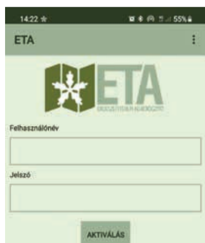
Ezeket a képeket láthatjuk a telefonon

Az erdészek a januári papíralapú bizonylatok alapján töltötték ki az el-