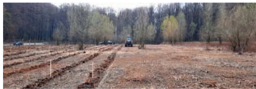
A Bakonyerdő Zrt. 100 hektár erdőt telepített

A szülők szemléletének formálásában ugyancsak aktívan közreműködnek, sok-sok családi rendezvényük van, ahol a gyermek és a szülei együtt pillanthatnak be a természet kulisszatitkaiba. Népszerűségüket jelzi, hogy a ország minden pontjáról érkeznek a gyenesdiási Festetics Imre Élmenyközpontba, sőt, külföldi vendégeik is vannak.