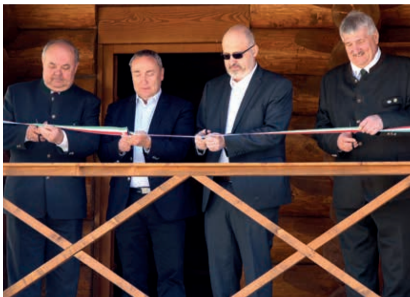
Az eredetivel megegyező külsőt kapott a rönkház

Napjainkban a természetjárás újra reneszánszát éli. Jelentős mértékben köszönhető ez azoknak az infrastrukturális fejlesztéseknek, amelyeket a hazai erdőkben a magyar kormány ösztönzött és támogatott.