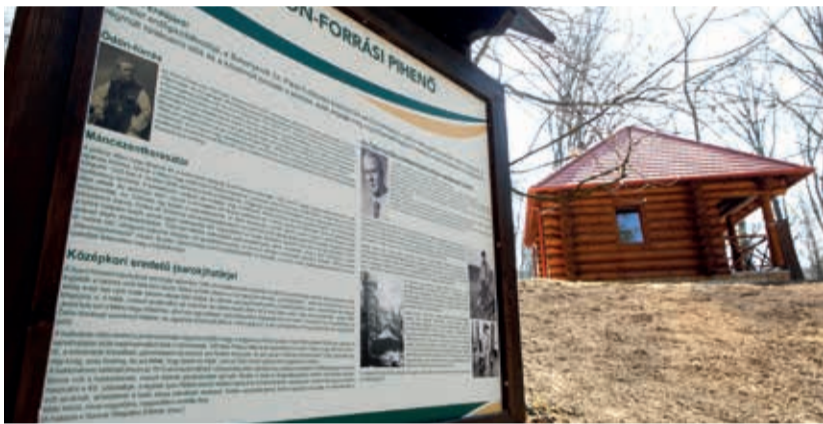
Nagyon sok idősebb pápait köt ide gyermekkori élmény

A program eleme volt a Bakony és a Balaton térségében leginkább kedvelt erdei kirándulóhelyek és a hozzájuk kapcsolódó turistaút-hálózat mentén megtalálható pihenőhelyek és információs rendszer felújítása. A projekt részeként a Bakonyerdő Zrt. egész területén összesen 1 új négy évszakos menedékház, 4 új erdei védőház került kialakításra, továbbá megújult 5