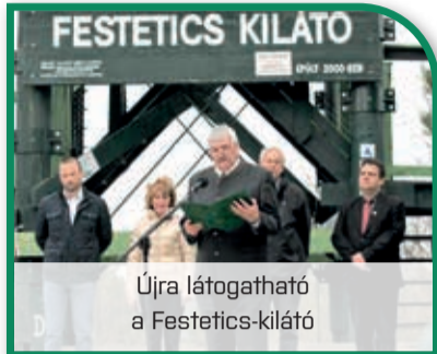
Újra látogatható a Festetics-kilátó