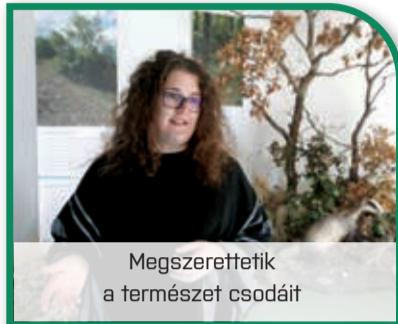
Megszereztetik a természet csodáit