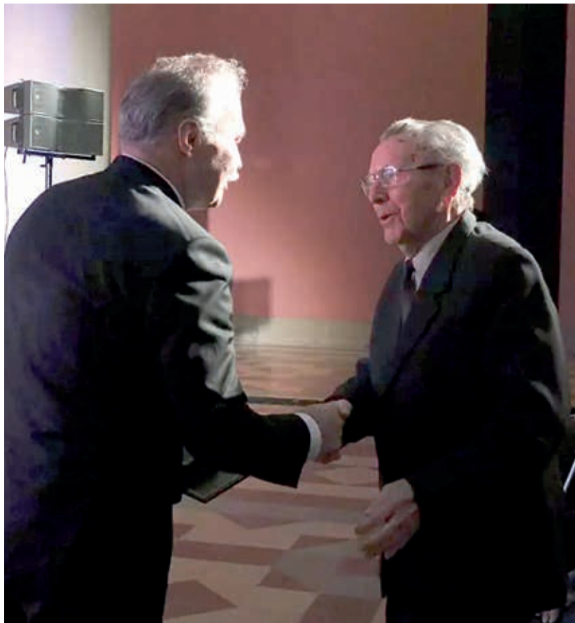
Nagy István és Czebei Sándor

Nagy István agrárminiszter az 1848/49-es forradalom és szabadságharc március 15-i évfordulója alkalmából rendezett kitüntetési ünnepségen Budapesten, a kitüntetéseket