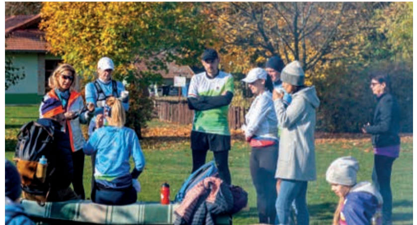
Az erdei futásnak nincs párja

Ezúton is szeretnénk megköszönni minden kollégának, aki hozzájárult az esemény sikeréhez és jó hangulathoz, a közreműködést! Az eseményekről és a programokról az OEE honlapján és a Sportolj tudatosan az erdőben! nyilvános Facebook-csoportban lehet tájékozódni.