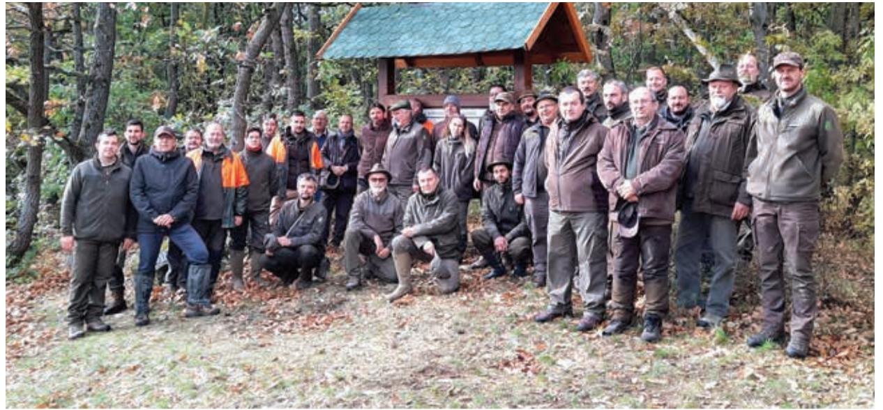
Jó a szakmai kapcsolat a mecseki és a bakonyi erdészek között

A járványhelyzet sem csengett le teljesen. Az oltakozással nem állunk rosszul. Ezzel együtt is állami céggként elvégeztettük az egyes munkakörök kockázatelemzését. Ez alapján határoztuk meg azt a kört, amelynek január 15-ig mindenképpen védettséget kell szereznie. Reméljük, a kollégák belátják, hogy elsősorban saját védelmük érdekében komolyan kell venni a járványügyi helyzetből adódó veszélyeket. A kockázatelemzés nem végleges, az aktuális Covid-helyzet ismeretében folyamatosan felülvizsgáljuk a veszélyeztetett munkakörök listáját.