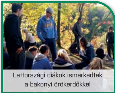
Lettországi diákok ismerkedtek a bakonyi örökerdőkkel