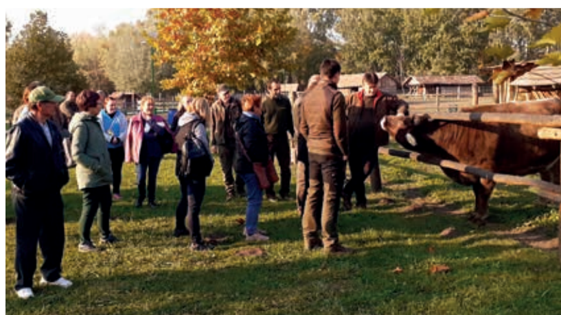
A vendégek a ritkaságszámba menő kárpáti borzderest, Bodzát is láthatták