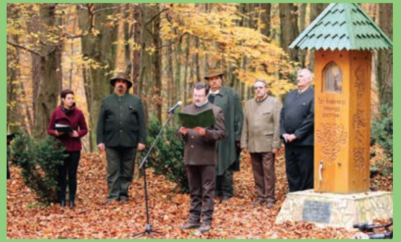
Ma már hagyománya van a hubertlaki innepségnek

Az esemény nagy sikernek örvendett, összesen 195 fő vett részt a Mikulás-napi barkácsoló programon.