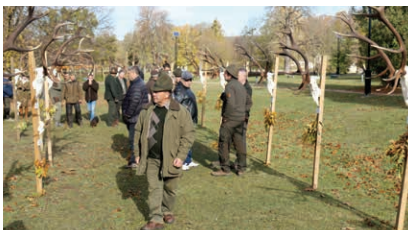
A megyei trófeaszemle jól tükrözi a vadgazdálkodási munkát

gyon büszke az általuk végzett szakmai munkára, amelynek eredményét a trófeák mennyisége és minősége is jól mutatja.