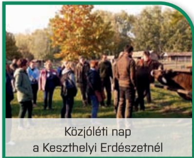
Közjóléti nap a Keszthelyi Erdészetnél