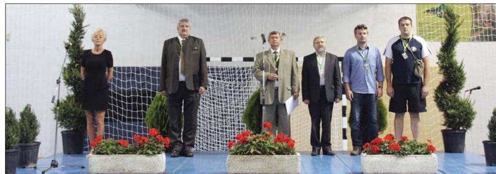
Az ünnepélyes megnyitóneműségeket a városi sportszarnokban tartották. A sportnap nemzetközivé nőtte ki magát

a sportolási lehetőségek mellett a szabadidő hasznos és tartalmas eltöltéséről is gondoskodtunk. Fesztivál volt ez a javából! Emlékeztess napokat tölthettek Pápa erdész kollégáink. (Összeállításunk a 3. oldalon található.)