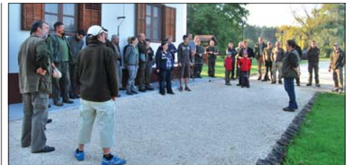
Egyre népszerűbb sárosfői házi horgászversenyünk

A gyermekek egynapos programjaink során kezűgyességüket próbára téve a környékterület, börművészség, nemezelés, fafaragás, kenyérsütés fortélyait is elleshetik és megtanulhatják. Válogathatnak a környékbeli látványok közül, melyeket gyalogosan vagy a kisonvont kényelmét élvezve kereshetnek fel.