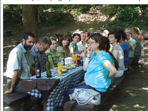
A nyári nagy melegben a Koloska-völgy árnyat adó fái alatt jó volt eszmét cserélni