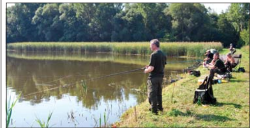
Érdemes volt botot fogni, a halak kapó kedvükben voltak