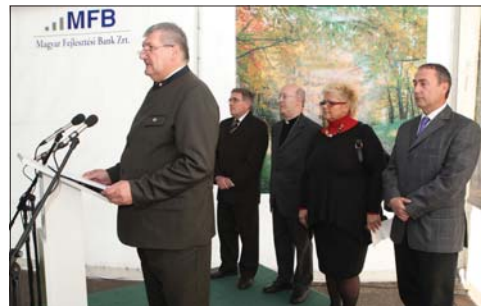
Rangos vendégek tisztelték meg a Franciavágási Fűrészüzemet

Fűrészáru-gyártóssal és brikettáloval bővült a Franciavágási Fűrészüzem, amivel új, piacképes termékek gyártására nyílt mód.