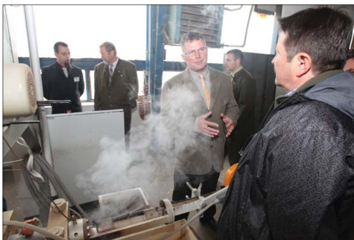
Franciavágáson bővült a kapacitás, új termékkel gyarapodott a paletta.

A Bakonyerdő Zrt. teljesíteni fogja szakmai terveit, sőt, néhány területen túl is szárnyaljuk az elvárásokat. Az elért eredmény közös munka gyümölcse, az erőfeszítéseknek köszönhetően visszamenőleges fizetésemelésre is sor kerül!