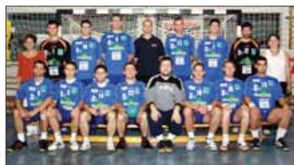
A Bakonyerdő Zrt. által támogatott pápai férfi kézilabdacsapat

Tízcsapatos csoportjukban nyolcadikak lettek az alapszakaszban, ám nem mindig tudták hozni könnyen nyerhető találkozóikat.