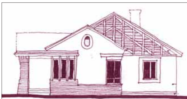
Miután elkészült, így fog kinézni a Devecseri Erdészet új irodaépülete. Visszafoglaljuk régi helyünkét

A vörösizsap-katasztrófa társaságunknak is jelentős károkat okozott, többek között a baleset nyomán le kellett bontani Devecseri Erdészetünk irodaházát. A tervek elkészültek, az időjárásától függően hamarosan kezdődhet a beruházás.