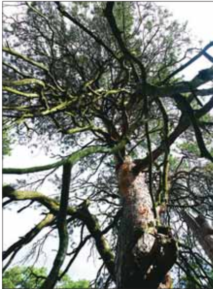
használtak, de a rönkkihozatal csak 10 százalék.

Erről tájékoztatott Bajner Attila, a tavaly októberben kinevezett erdészeti igazgató. Fő fafajuk a területfoglalás alapján a cser (28 százalék), amit a bükk (21), erdei fenyő (16), gyertyán (9), akác (7,5), tölgy (7,5) követ. A faállomány fakészlete más képet mutat, eszerint már a bükk meghatározó, amely 33 százalékot képvisel. A véghasználatok után mintegy 55 hektár felújítási kötelezettség keletkezik, tudtuk meg Bajner Attilától. 90 százalékban a mai kor követelményeinek megfelelően fokozatos felújító vágásokat alkalmaznak. A véghasználatok tíz százaléka tarvágás, az elegenden fenyveseket, akácosokat, égereseket csak így lehet felújítani. A tölgyeket esetében is alátelítéssel, pótlással oldják meg a felújítást. Mindezek érdekében évi 400 ezer csemét ültetnek. Éves fakitermelésük nettó 35 ezer köbméter, ennek mintegy kétharmada vég-