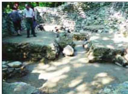
A képen a régészeti ásatások során előkerült mellékkápolna falmaradványai és az oltár alapja látható