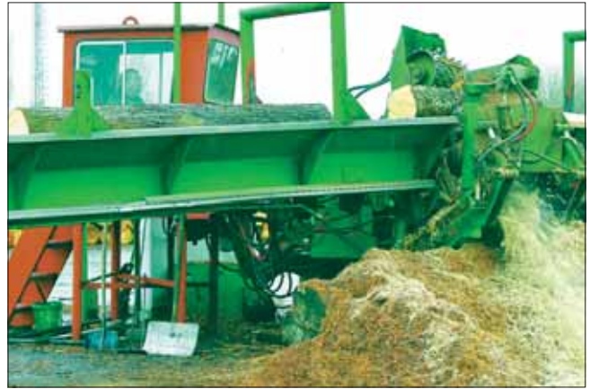
Franciavágáson is le kell faragni a költségeket. Az üzem tevékenységének ésszerűsítése elkerülhetetlen

A termeléshez szükséges kiegészítő tevékenységek, mint a porészívás, anyagmozgatás, hulladékprítás viszonyait is áttekintették. Vizsgálták a termékösszetételt, a termékek gyártási menetét, a szállításhoz alkalmazott bevágási és számlázási arányokat kalkulálták. Figyelemmel voltak az egyes termelőcsoportok létszámaira és a termelők helyi feltételezett produktivitására. Somo-