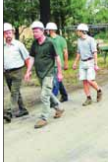
A Vértesi Erdő Zrt. és az OEE pápai helyi csoportja tartalmas programot állított össze a vendégeknél

Ebben a házikóban, no meg pár négyzetméteres kertjében éltek a magányos életüket. Ez alól kivétel csak a húsvét és a karácsony jelentett, amikor 3-3 napra előjöhetek, közösen imádkozhatnak. Beszélniük azonban ekkor sem volt szabad.